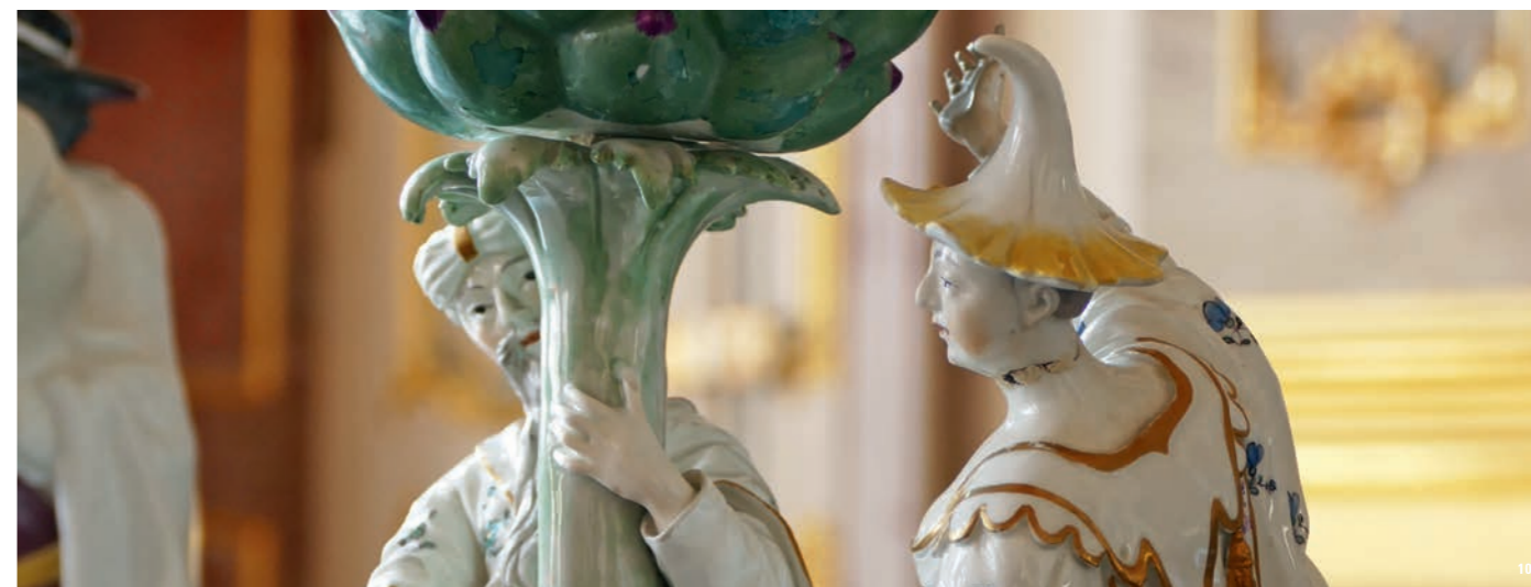
Gruppe aus Frankenthaler Porzellan – einer der vielen Kunstschatze in Schloss Bruchsal

Wie gingen die Menschen mit ihrer Sehnsucht nach Exotik und fernen Welten um? Unsere Monumente zeigen es.