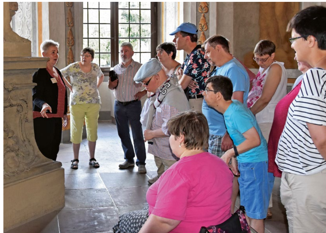
👑 Führung in Leichter Sprache im Garten-saal.

Für diese Menschen sind die Führungen in einfacher Sprache und Leichter Sprache gedacht: